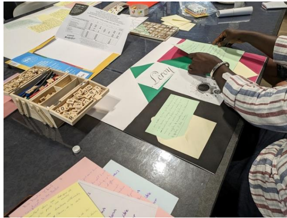
Tableau autour de la montre Leroy

poétiques en plus. "On convoque les émotions et l'histoire personnelle de chacun, mais sans enjeu, simplement l'art" affirme l'assistant social. "On a eu des gros moments d'émotions avec des textes qui ont donné les larmes aux yeux à tout le monde" indique quant à elle l'autrice.